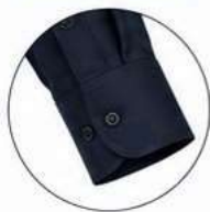
PUNHO COM BOTÃO