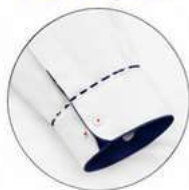
PUNHO COM ABERTURA