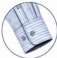
PUNHO COM BOTÃO