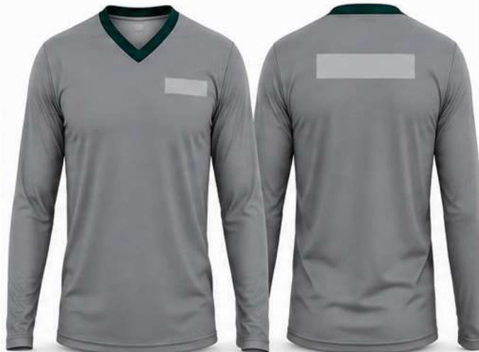
MODELO SEM FAIXA REFLETIVA