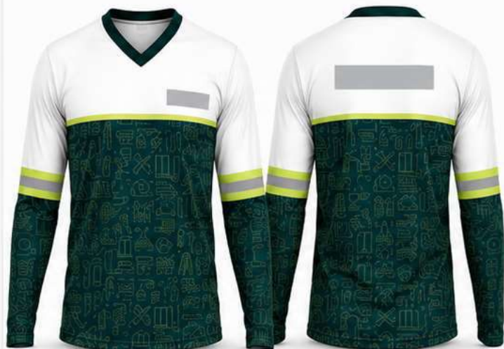
MODELO COM FAIXA REFLETIVA