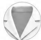
GOLA E ACABAMENTO BRANCO