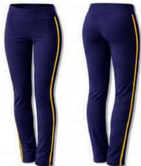
CALÇA FEMININA EM HELANCA DE CÓS