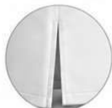
ABERTURA LADO ESQUERDO SOBRE O DIREITO 25 CM