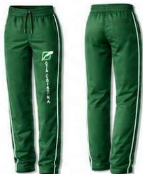
CALÇA UNISSEX EM TACTEL