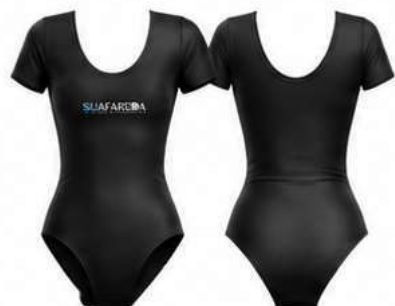
BODY MANGA CURTA