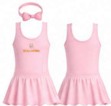
VESTIDO COM SAIA