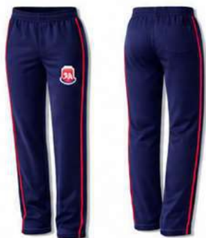
CALÇA MASCULINA EM HELANCA DE ELÁSTICO