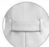
PENCE COM COSTURA